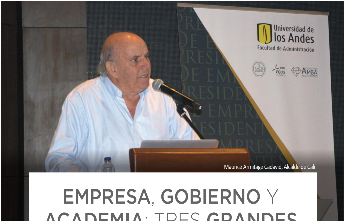
Maurice Armitage Cadavid, Alcalde de Cali