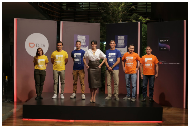
Imagen DiDi - 2021

El pasado viernes 19 de marzo salió al aire el primer episodio de DiDi Lab presentado por Shark Tank Colombia, un laboratorio para la reactivación económica del país, organizado por DiDi y Sony Channel con el apoyo de la Universidad de los Andes. En total se recibieron más de 700 postulaciones de emprendimientos colombianos, de los cuales 6 fueron seleccionados por un comité evaluador de la Universidad de los Andes.