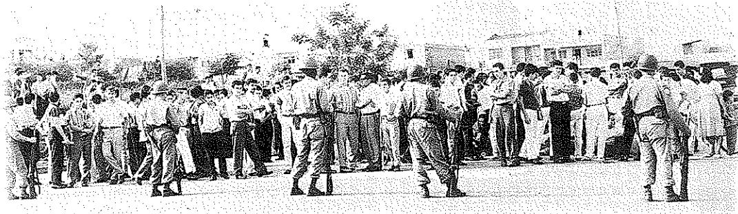
El ejército se tomó la UIS. Junio 1964