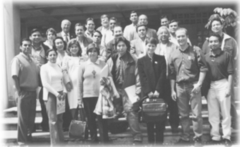
En la foto aparecen los participantes del programa de Salud de la ESAN de Lima, Peru, acompañados de los coordinadores de la pasantía.