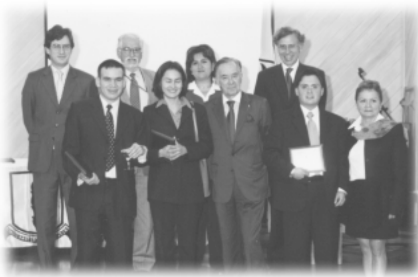
Entrega Beca Vegalara