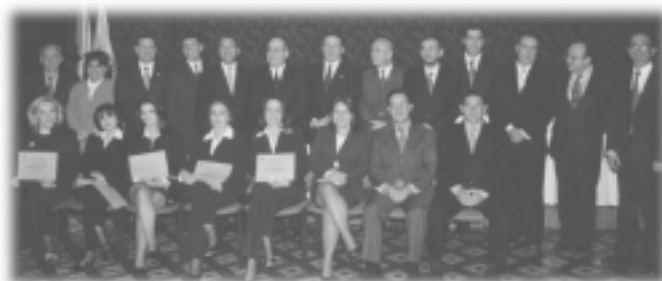
Promoción No. 47, Bogotá

Por otra parte, en Bogotá, el 29 de mayo se entregaron los certificados a 20 participantes de la promoción no. 47; y en Medellín, el 19 de julio finalizó la segunda promoción con la entrega de 28 certificados de Alta Gerencia.