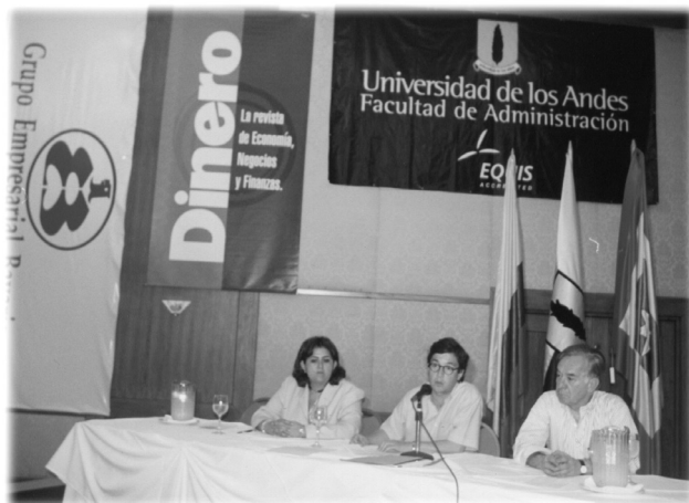
Luis Alberto Moreno, embajador de Colombia en Estados Unidos, fue el encargado del cierre con la conferencia Perspectivas de los acuerdos comerciales.