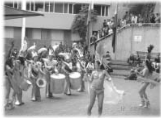
Muestra artística en el Día Internacional de Administración