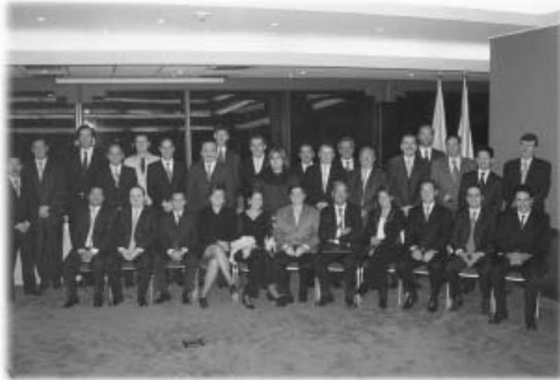
Magíster Ejecutivo Promoción 2002 - 2004

En la ceremonia de grados de la Universidad de los Andes, realizada el 9 de abril se entregaron los diplomas de Maestría en Administración a veinte estudiantes de la promoción 2002-2004 del Magíster Ejecutivo.