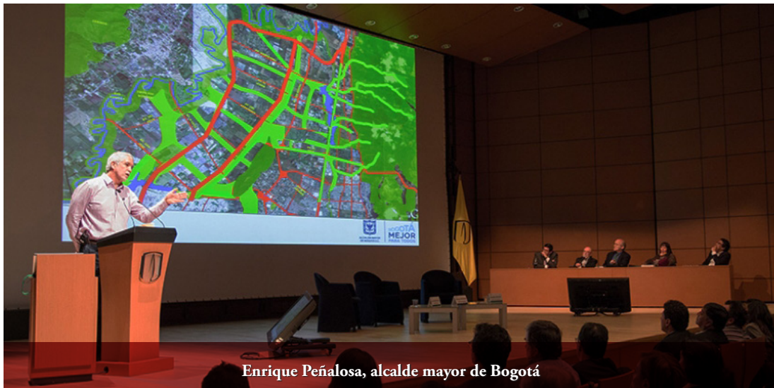
Enrique Peñalosa, alcalde mayor de Bogotá

El foro se emitió por televisión en vivo y en diferido. Ha sido el programa con la mayor audiencia en la historia de la Universidad de los Andes, con 5.421 televidentes en directo, más de 45.000 en diferido durante una semana y 60.000 reproducciones de la versión resumida en Facebook. El evento fue el primer intercambio de puntos de vista entre el alcalde y los principales contradictores de la propuesta para urbanizar la reserva ubicada al norte de la ciudad, único espacio donde aún existe relación continua entre los cerros orientales, el río y la sabana de Bogotá.